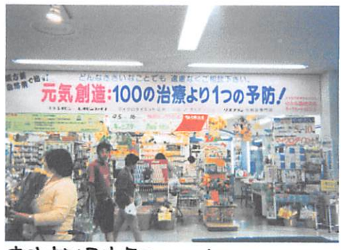
支店第1号店「テックハートほなみ」 パワービル内にありました(2005年)

この頃から「お母さん、私も大人になったらこの薬局を継ぎたいな」と思っていたことを覚えています。